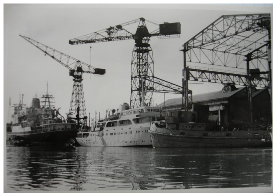
Les chantiers Dubigeon et sa grue marteau en 1955

Autrefois, dans chaque grand port de France, on pouvait observer des dizaines de grues dans le paysage urbain, ce qui totalisait quelques centaines sur le littoral français. Ce nombre a été fortement réduit, du fait du déclin des grands ports industriels de France au cours des années 60, de la modernisation de l'activité de construction navale et de la démolition des anciens sites. Ainsi, Nantes est devenue la seule ville de France à posséder 3 des 5 grues protégées au titre des Monuments Historiques sur le territoire national.