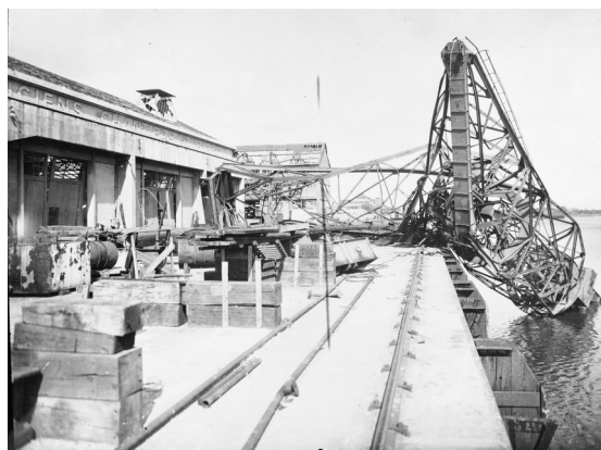
La Grue Noire, détruite en 1944 par l'armée allemande