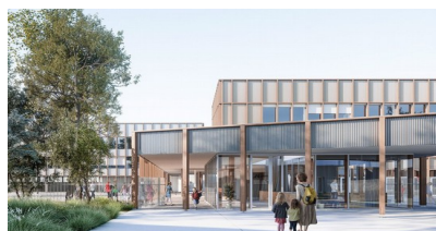
Projet Hall d'accueil Ecole Urbain Le Verrier - Atelier Mim