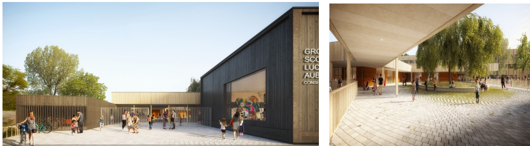
Projet Mille architectes - groupe scolaire Lucie Aubrac