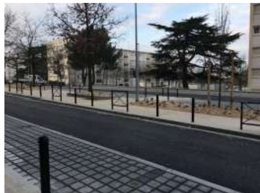
Aménagements des espaces publics aux abords du Grand Watteau