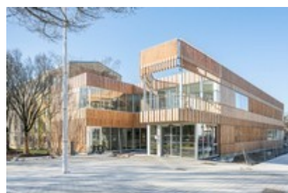
Maison de santé de Bellevue