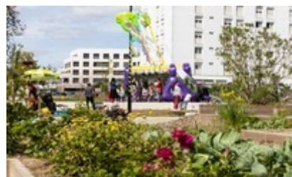
Square Michelle Pallas